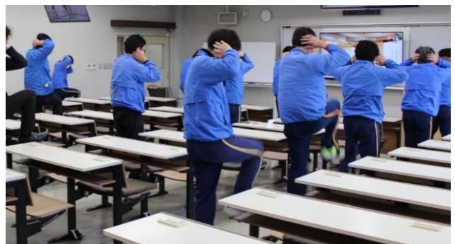
▲毎朝行っているエクササイズの様子