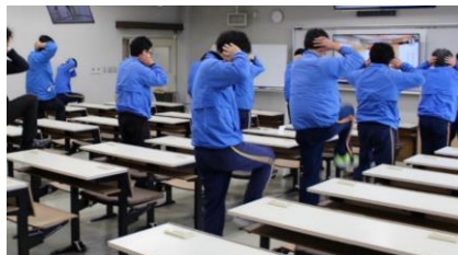
毎朝行っているエクササイズの様子