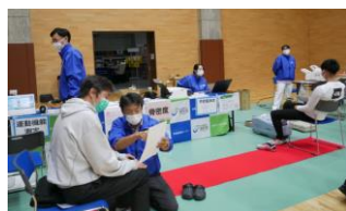
オータムフェスタと測定ブース