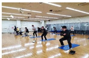
生活習慣病改善プロジェクト「健幸くらす」