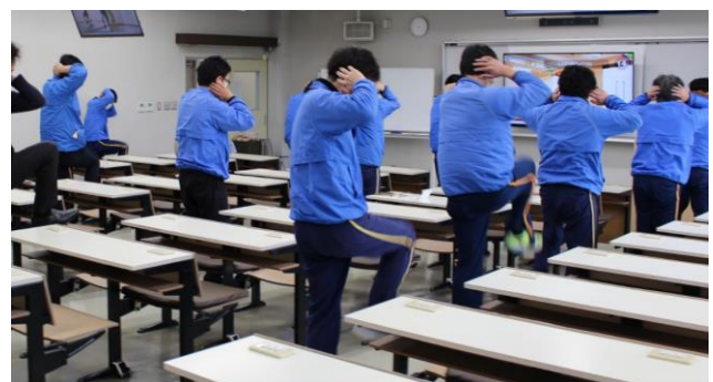
▲毎朝行っているエクササイズの様子