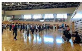
オータムフェスタと測定ブース