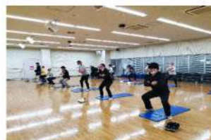
生活習慣病改善プロジェクト「健幸くらす」