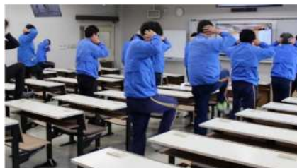
毎朝行っているエクササイズの様子